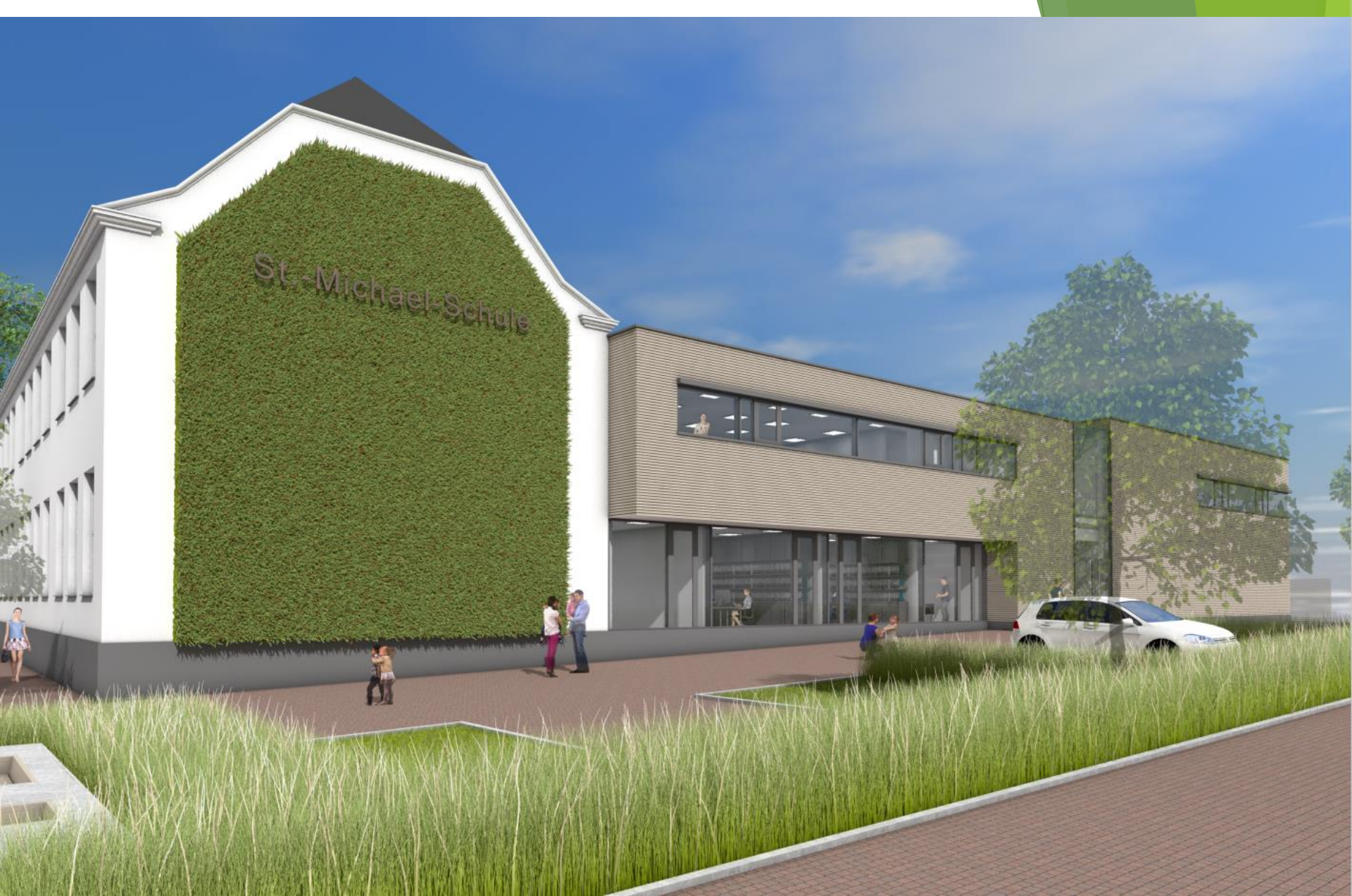
Blick vom Parkplatz auf den Altbau mit Grünfassade und den Neubau